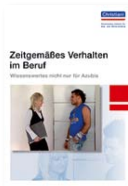
Zeitgemäßes Verhalten im Beruf, 1. Auflage 2008, 109 Seiten, A4, Best.-Nr. 82002, ISBN 978-3-86522-391-3, 14,80 Euro