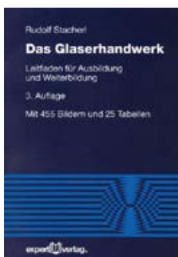
Das Glaserhandwerk, 3. Aufl. 2008, 403 S., 455 Abb., 57,- Euro, ISBN-13: 978-3-8169-2804-1