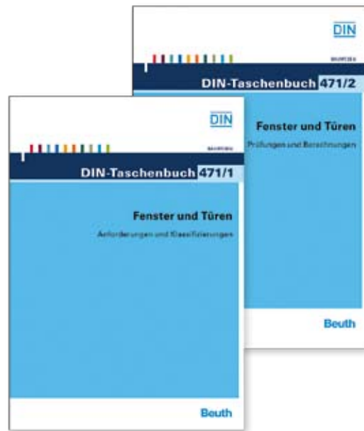
DIN-Taschenbuch 471/1, Fenster und Türen, Anforderungen und Klassifizierungen, 1. Auflage 2008. 312 S. A5. Broschiert. 71,60 Euro, ISBN 978-3-410-10687-6

Unter dem gemeinsamen Titel "Fenster und Türen" stellen die beiden Taschenbuch-Erstaufgaben eine profunde Auswahl an aktuellen europäisch harmonisierten Normen bereit: Grundlage des DIN-Taschenbuches 471/1 "Anforderungen und Klassifizierungen" ist die Europäische Produktnorm DIN EN 14351-1 über Fenster und Außentüren ohne Eigenschaften bezüglich Feuerschutz und/oder Raumdichtheit, ergänzt durch insgesamt 15 Normen zur Klassifizierung der Anforderungen an die verschiedenen Leistungseigenschaften von Fenstern und Türen sowie durch Normen zu Schließern und Baubeschlägen. Das DIN-Taschenbuch 471/2 "Prüfungen und Berechnungen" enthält 28 DIN-EN-, DIN-V-ENV und DIN-EN-ISO-Normen mit den erforderlichen Prüf- und Berechnungsverfahren für Fenster und Türen.