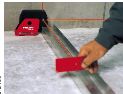
Präzises Ausrichten mit dem Punktlaser PMP 34

Hilti Deutschland GmbH 86916 Kaufering Tel. (08 00) 8 88 55 22 jn@nowmarketing.de www.hilti.de