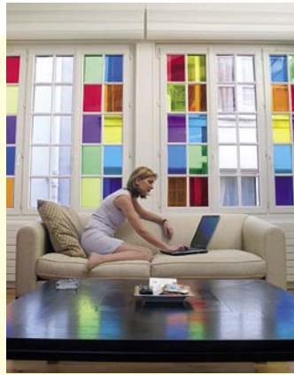
Folien für individuelle Raumgestaltung