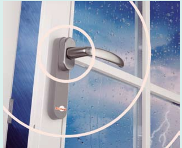
„SecuSignal“ überträgt die Stellung des Fenstergriffs bei Betätigung per batterielosem Funksender

Der Funksender arbeitet komplett ohne Verkabelung oder sonst übliche Batterie. Die Energie wird beim Drehen des „SecuSignal“-Fenstergriffes direkt mit Hilfe eines patentierten Systems erzeugt. Dadurch gibt es kein lästiges Überwachen und Wechseln von Batterien und keinen umweltschädlichen Batterie-Müll. Der Funksender ist absolut wartungsfrei.