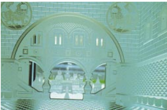
Die Entscheidung ist gefallen, die Sieger des Glasveredlerpreis '96 stehen fest. Die GLASWELT stellt die eingereichten Arbeiten vor.