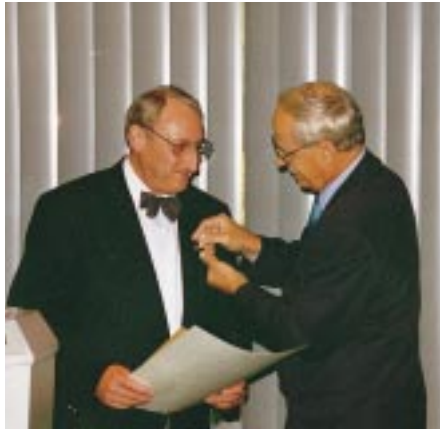
Anläßlich der Glastec fand die Mitgliederversammlung des Bundesinnungsverbands statt. Höhepunkt: die Wahlen des Vorstands.