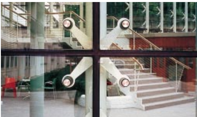
Punktgehalten: Isoliergläser in der Fassade