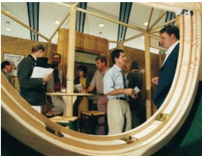
Eine runde Sache: Die Fensterbau '97 bescherte den Ausstellern eine verbesserte Auftragslage