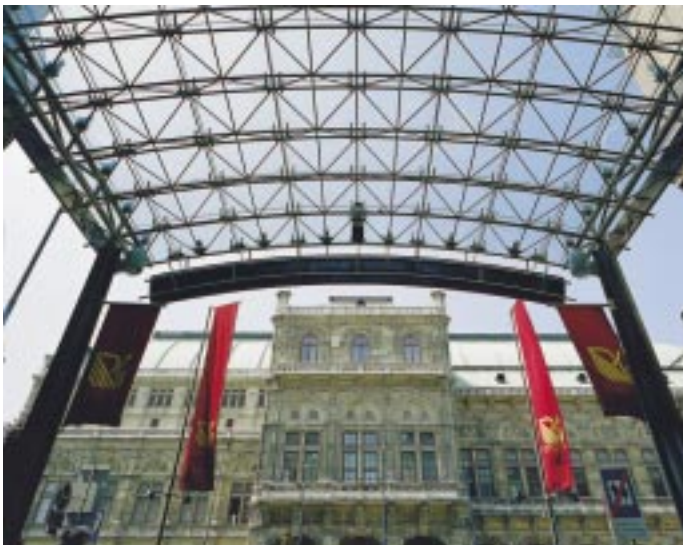
Blickpunkt Österreich: Firmen, Produkte, Daten und Fakten aus der Alpenrepublik