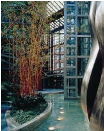
Die Bambushalle ist das Herz des Bürocenters Top Tegel in Berlin