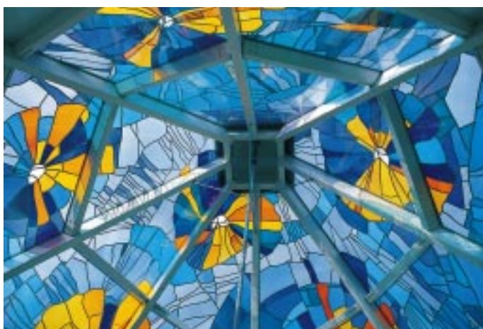
Vom trutzigen Turm zum Schmuckkästchen: das pyramidenförmige Dach lichtet Gemäuer der mittelalterlichen Anlage von Schloß Ardeck