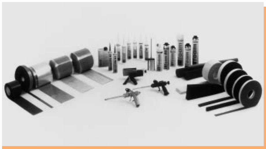
Das Abdichtungssortiment rund ums Fenster

Kein leichtes Unterfangen bei den vielfältigen Abdichtungsmaterialien, die der Markt bietet. Umfragen des Herstellers machten deutlich, was sich Architekten in der Planungsphase wünschen: Ein unkompliziertes Abdichtungssystem, dessen Systemkomponenten den speziellen technischen und bauphysikalischen Anforderungen in jeder Hinsicht gerecht werden.