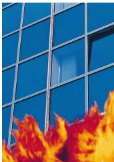
Brandschutz integriert im Fassadendesign

zu tragen. Leider werde aber bei vielen Vorhang-Profilfassaden der Schutz gegen Feuerüberschlag noch nicht sorgfältig genug geplant.