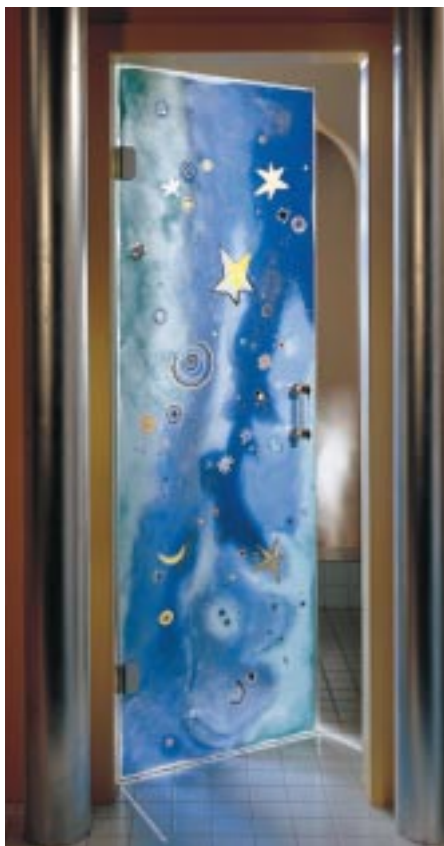
Sternenträumerei auf Satinato

gestalten. Die Herstellungstechniken der Türen – vom Handmalen, Sandstrahlen bis zum Gravieren – wurden im Laufe der Jahre perfektioniert und reizen zu immer wieder neuen Kombinationen.