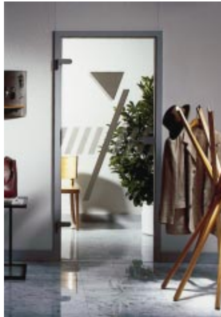
Schöner Wohnen in lichtdurchfluteten Räumen

In punkto Stabilität stehen Ganzglastüren herkömmlichen Innentüren praktisch nicht nach. Im Gegenteil: Türen aus Einscheiben-Sicherheitsglas sind pflegeleicht, kratzunempfindlich