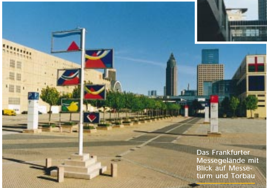
Das Frankfurter Messegelände mit Blick auf Messturm und Torbau

Die Fachmesse Gallery ist seit mindestens 10 Jahren begleitet von Rahmenveranstaltungen, die das Programm der Aussteller sinnvoll ergänzen. Erinnert sei an Einrahmer-Wettbewerbe, verbunden mit Ausstellungen, die in Zusammenarbeit der Messeleitung mit dem Bundesverband Bild und Rahmen organisiert wurden. Viel beachtet wurden auch Sonderausstellungen zu Themen wie „Chinesische Kalligraphie“ und „Alte Rahmen und Rahmenmacher-Kunst“. Auch Workshops mit Demonstrationen von Techniken der Druckgrafik, der Passepartout-Gestaltung und der Blattvergoldung kamen bei den Messebesuchern gut