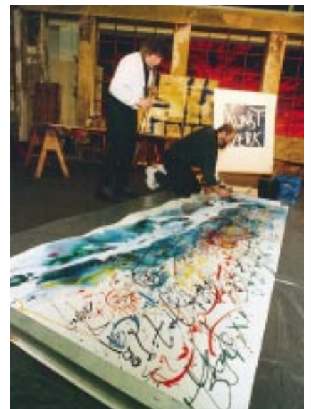
Künstler bei einer Sonderveranstaltung der Gallery im Rahmen der Ambiente '99

an, ebenso Sonderaktionen zu anderen Themen wie z. B. „Dekoration und Schaufenstergestaltung im Kunsthandel“. Solche ergänzenden Programme im Rahmen der Gallery wird es auch künftig geben.