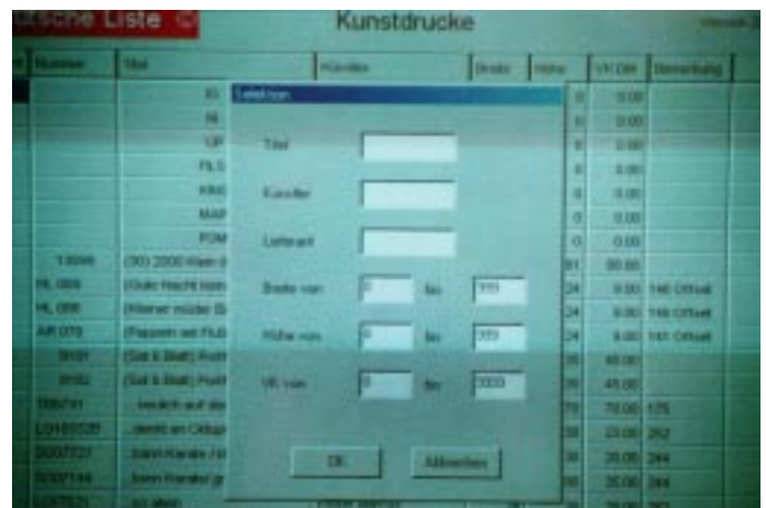
Deutsche Liste: Eingabe-Maske Kunstdrucke-Suchprogramm

Computer lediglich per Mausklick auf hierfür vorgesehene Schalter auf der Eingabemaske übermittelt. Blitzschnell erscheint dann der vom Programm errechnete Preis. Für mehrere Einrahmungsalternativen lassen sich die Preise innerhalb Sekunden ermitteln. Zweifel an deren Richtigkeit sind ausgeschlossen, falls die Eingabe korrekt war.