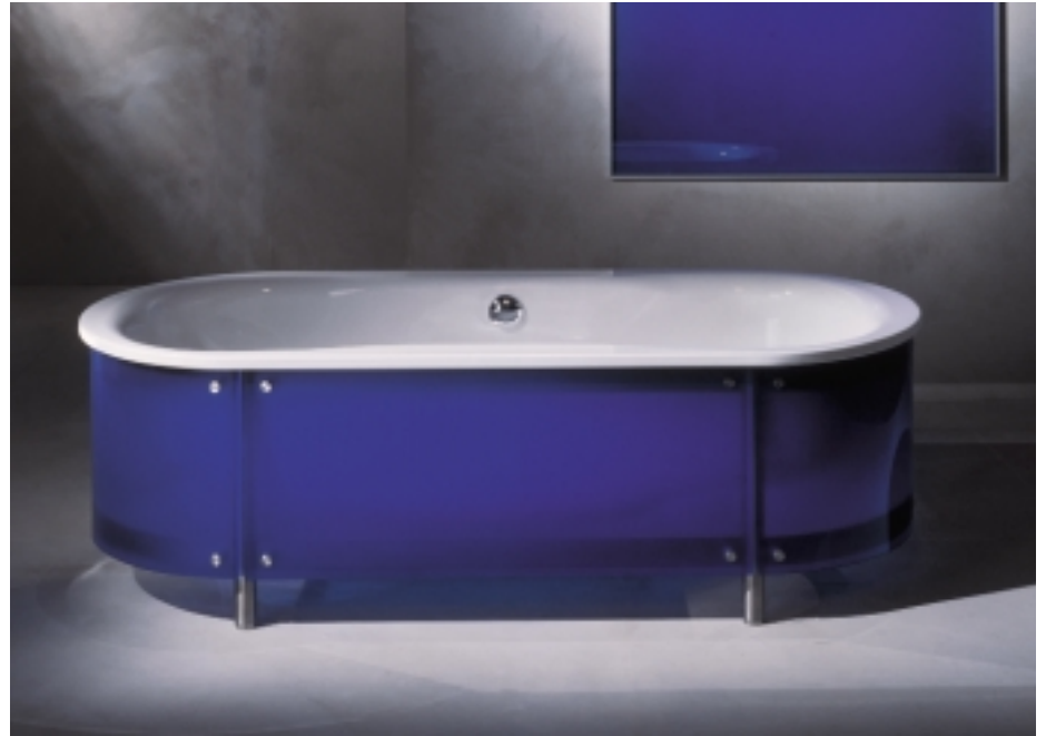
Die „Blaue Badewanne“ von Schott Desag ist ein besonderer Blickfang für anspruchsvolle Badezimmer

Die neue Produktpalette besitzt nicht nur einen hohen Sicherheitsstandard und ein innovatives Design, sie wird auch durch neue Vertriebswege ergänzt. In Zukunft kann der Kunde bei seinem Einzelhändler alles aus einer Hand beziehen. Dort kann er zum Beispiel nicht nur ein Glaswaschbecken erstehen, sondern Becken, die in abgestimmte Designsysteme integriert sind, mit exklusiven Armaturen, ästhetischen Unterbauten und abgestimmten Rohrleitungen. Lieferbar sind die Waschbecken mit verschiedenen Glasarten in