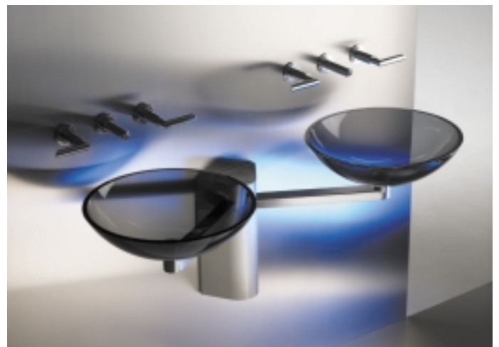
Die Doppereinheit aus Glas ist mit formschönen Armaturen bestückt, die auf das Designsystem abgestimmt sind