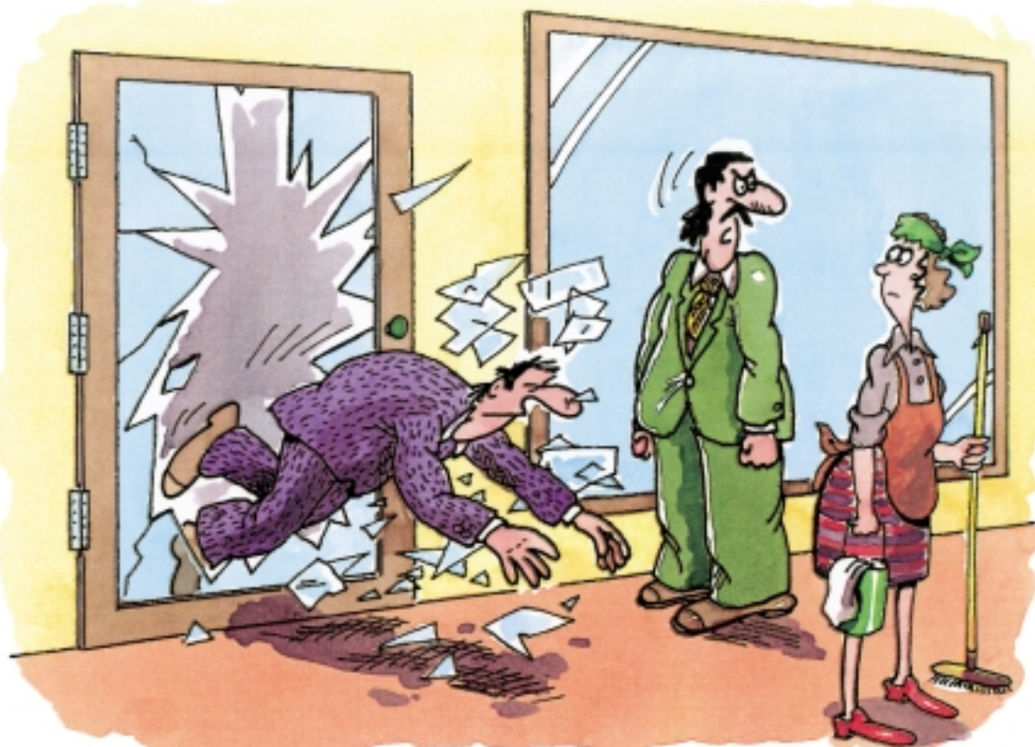
*Frühjahrsputz oder nicht, die Türscheibe sollten Sie dreckig lassen!*