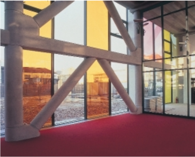
Die Detailansicht zeigt, wie mit den „Vanceva-VSG-Folien“ Räume mit farbigen und gemusterten Glaswänden strukturiert werden können