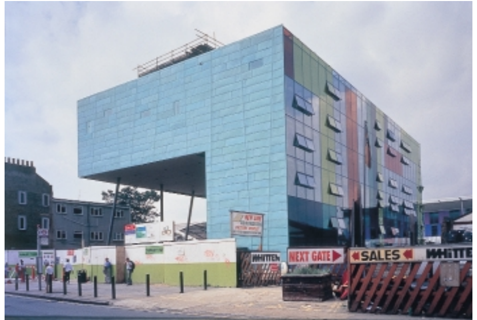
„Vanceva Design Color“ kam bei der Fassade der Peckham Bibliothek in London zum Einsatz. Als „Gebäude des Jahres“ erhielt es den „Stirling-Architektur-Preis“

Auf Basis von „Vanceva Design Color“ können aus einer Palette von neun Grundfarben viele verschiedene Farbtöne hergestellt werden. Die große Menge an Kombinationen wird durch die Verbindung von bis zu vier dieser Folien aus Polyvinylbutyral (PVB) möglich. Zusätzliche Spielräume bieten sich durch die Kombinationsmöglichkeiten von „Vanceva Design Color“ und „Vanceva Design Pattern“. Die gemusterten Folien aus Polyethylen (PET) sind zwischen zwei PVB-Folien eingebettet und werden von zwei Glasscheiben eingeschlossen. Auch bei den Folien der Reihe „Vanceva Design Pattern“ kann aus einer Palette von neun Grundmustern ge-