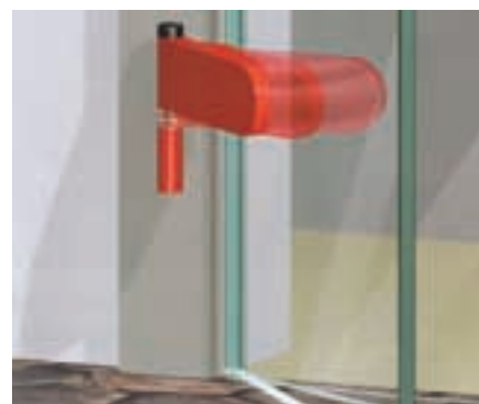
Das „Türhebeband“ verfügt über ein Bandstift mit Gewindespindel, wodurch sich der Türflügel beim Öffnen leicht anhebt und so Bodenunebenheiten überbrückt

Eine praktische Lösung zur seitlichen Fixierung von Fensterrahmen stellt die „Seitenbefestigung“ dar, die aus hochwertigem Kunststoff zur Vermeidung von Kältebrücken besteht. Der Anschluß ist an jedem Fensterprofil in Holz oder Kunststoff möglich, wobei die Befestigung durch Schlag-