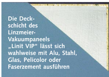
Die Deckschicht des Linzmeier-Vakuumpaneels „Linit VIP“ lässt sich wahlweise mit Alu, Stahl, Glas, Pelicolor oder Faserzement ausführen

Die innovative Dämmplatte mit dem mikroporösen Kern aus Kieselsäure (SiO 2 ) bietet die hervorragenden Dämmeigenschaften des Vakuums. Sie ist dimensionsstabil und temperaturbeständig (bis max. 800 °C). Nach dem Einbringen in die Umhüllung wird das System auf ein Vakuum < 1,5 mbar gebracht. Die dampfdichte Versiegelung und der druckfeste Einleimer sorgen für einen hochwertigen Randverbund. Durch den hohen Vorfertigungsgrad besteht ein, laut Hersteller, dauerhafter Schutz des Vakuuminhaltungs-Panels im Fassadenelement. Tauwasserbildung im Dämmstoff gehören damit, so Linzmeier, der Vergangenheit an.