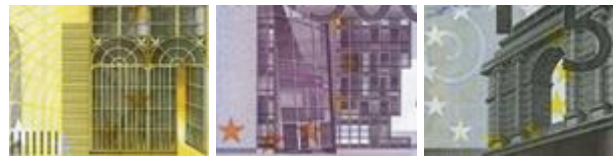
Fenster und Türen auf Banknoten